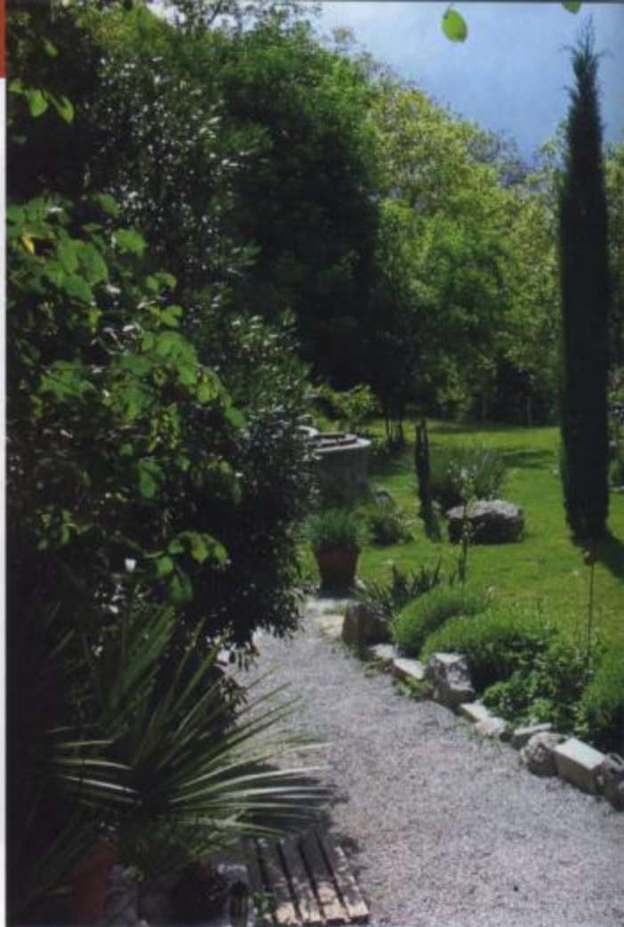
Prva terasa ob stari hiši