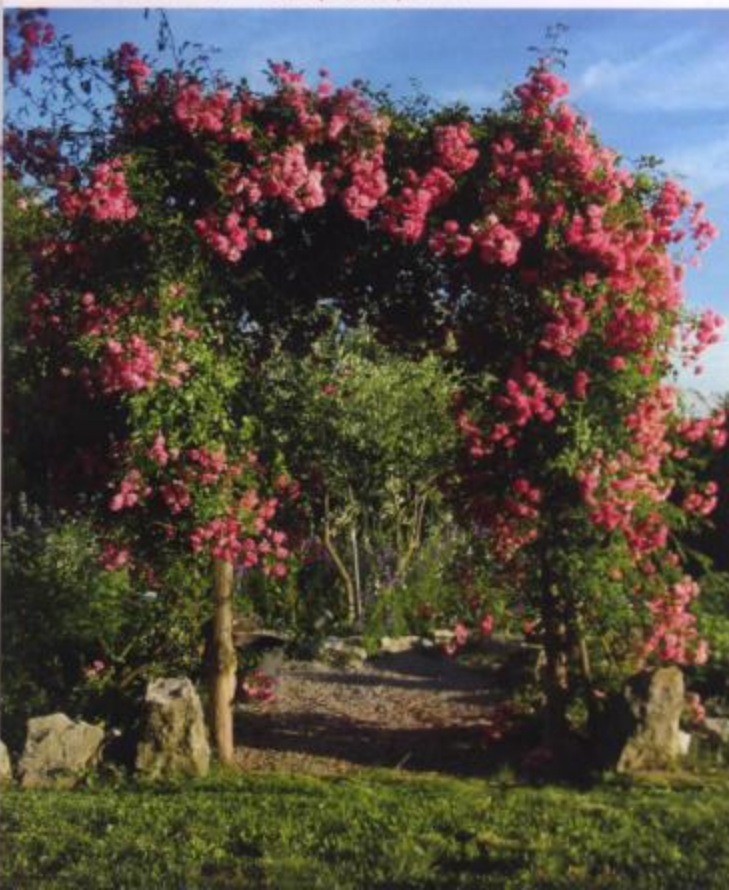
Portal z vrtnico - v ozadju zelenjavni vrt

Britta Hörschele se je rodila leta 1965 v Stuttgartu. Po opravljeni maturi se je tri leta šolala za poklic vrtnarke sobnih rastlin. Do leta 1990 si je nato v številnih vrtnarijah na območju Stuttgarta in Münchna pridobila dragocene izkušnje o urejanju okrasnih vrtov. Leta 1990 se je s svojim poznejšim soprogom Erikom Modicem preselila v Ljubljano. Po rojstvu svojega sina leto pozneje se je v čedalje večji meri ukvarjala z otroškimi ilustracijami in z delom z otroki. Vodila je nekaj kreativnih delavnic za otroke in izdala knjigo ter koledar za kreativno delo z otroki. V tem času je ilustrirala tudi otroško knjigo in s svojimi ilustracijami sodelovala pri reviji Ciciban in pri nekaterih posebnih izdajah Rdečega križa Slovenije. V zadnjih letih pa se kot samorastnica-avtodidaktka poleg otroških ilustracij ukvarja predvsem s slikarstvom in z grafiko. Na področju urejanja vrta in vrtnarstva pa je prav na Krasu odkrila svojo ljubezen do vrtov in tu še posebej do starih vrtnic. Danes neguje že blizu sto različnih vrtnic. V okviru številnih potovanj po tujini in tudi na podlagi spodbudnih besed posameznih obiskovalcev je sčasoma prišla do spoznanja, da bi lahko svojo kreativnost na umetniškem in vrtnarskem področju prikazala tudi širši javnosti. Tako je nastala zamisel, da si v nekdanjem hlevu obstoječe domačije uredi umetniško galerijo s pripadajočim vrtom okrasnih rastlin, ki naj bosta dostopna tudi za javnost.